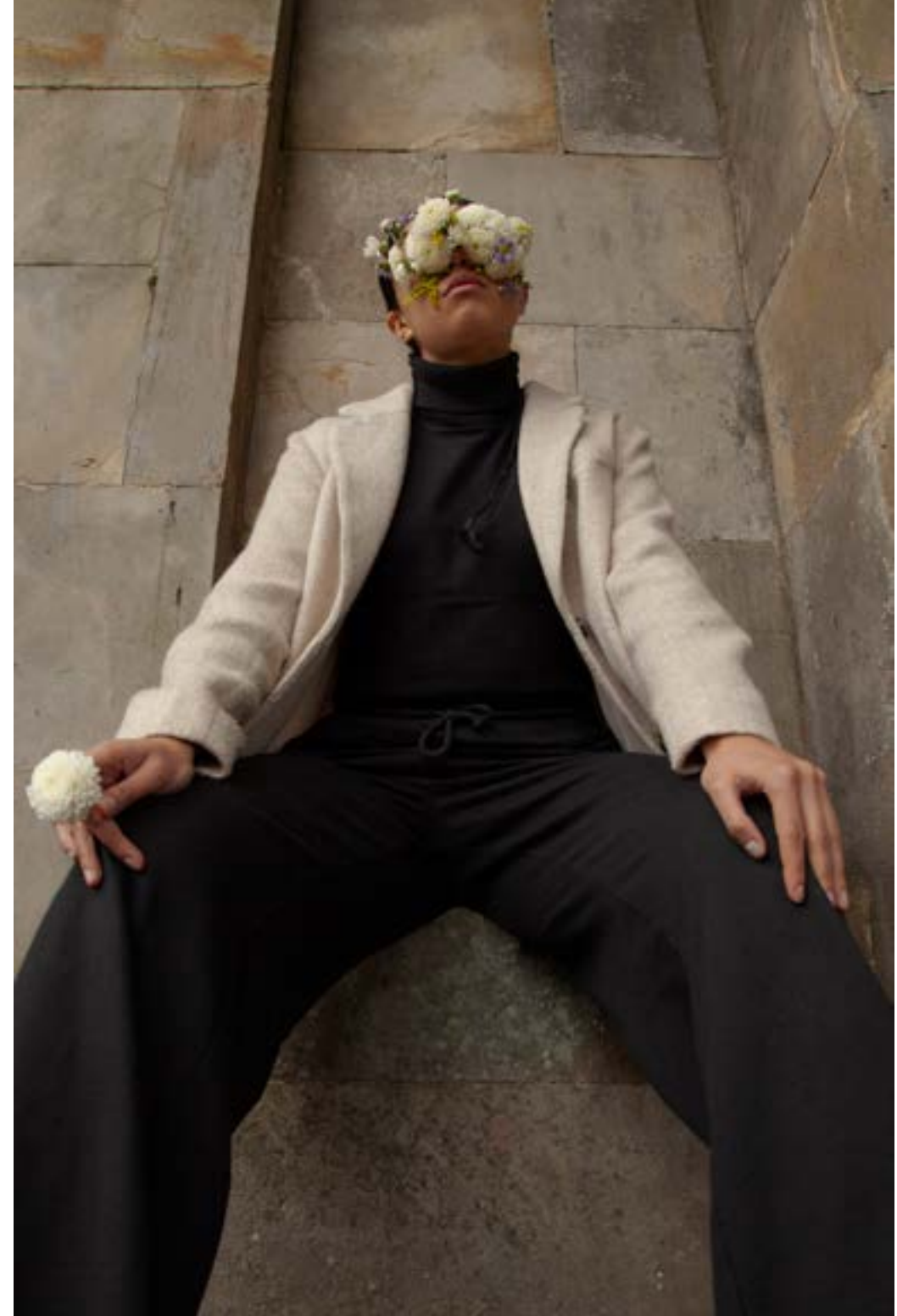
Fotografía final del personaje de Luz.

Esto planteado desde una perspectiva artística que presenta un recorrido de las características personales a través de los cuerpos y los objetos, manifestado mediante imágenes fotográficas, animaciones en stop motion y sonidos que permiten reconocer al sujeto desde una realidad re-construida.