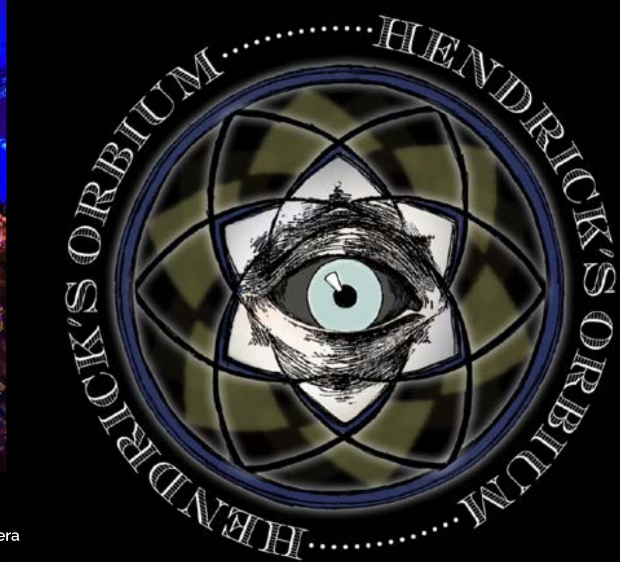
Activación de marca Hendrick's Orbium en Bogotá Animación de Mappings sobre paredes del lugar_Sebastián Herrera