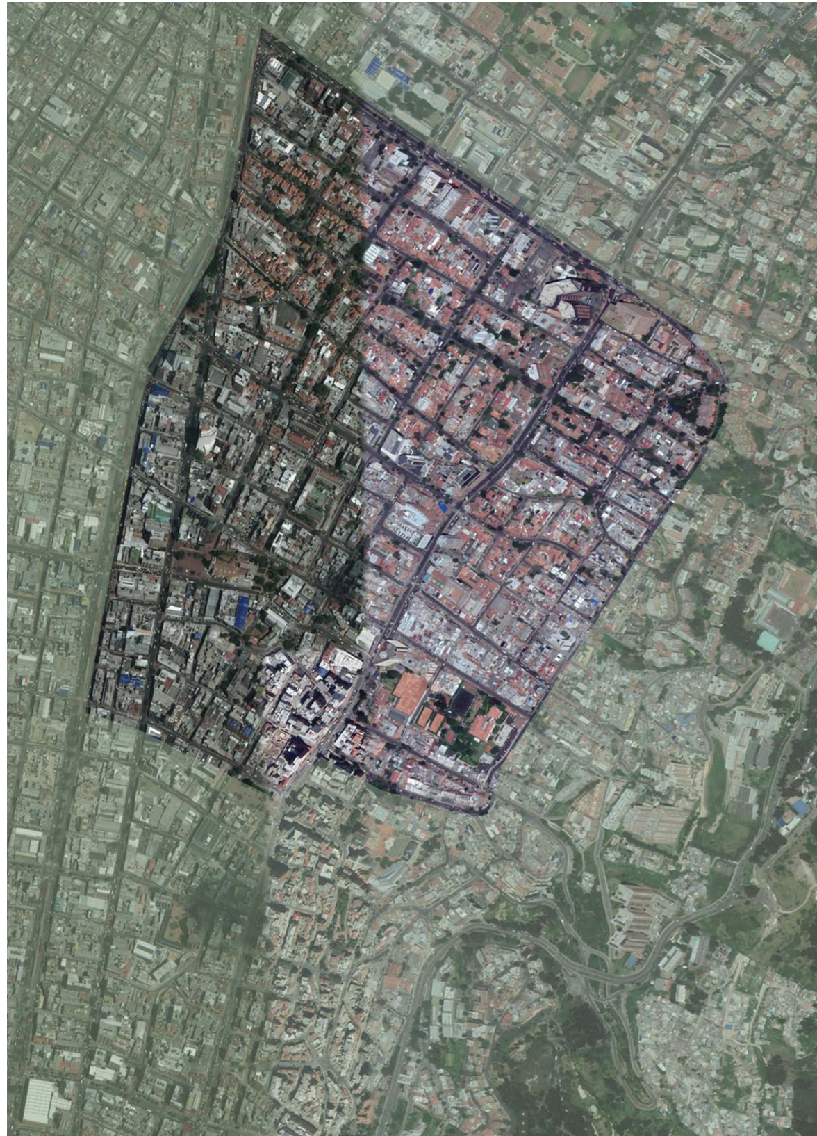
Figura 1. Aerofotografía área de trabajo